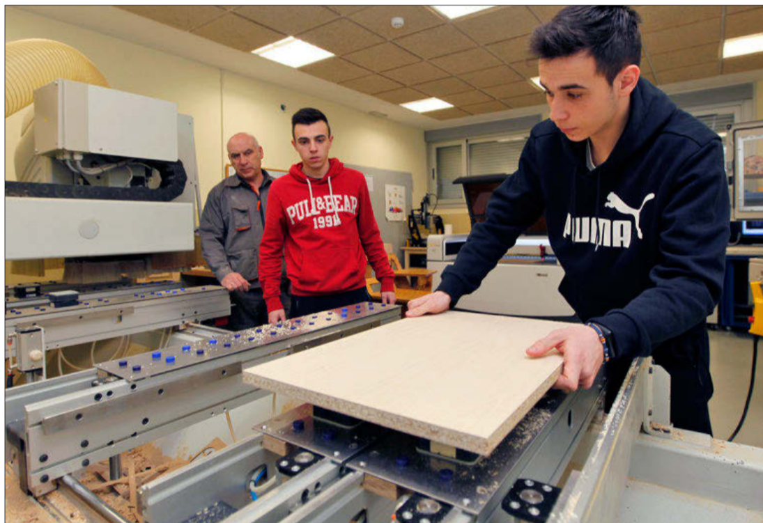
Alumnos del Pico Frentes, centro participante en las Becas, en una imagen de archivo. MARIO TEJEDOR

Las Becas Julián Sanz del Río están dirigidas a alumnos matriculados en el último año correspondiente a la obtención del título