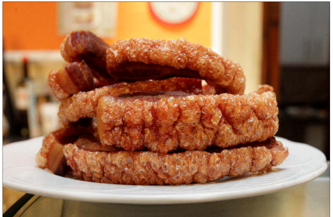
El Torrezno de Soria se ha convertido en el producto de la provincia con mayores ventas. MARIO TEJEDOR

La participación en el concurso de la tapa innovadora será opcional para quienes deseen innovar