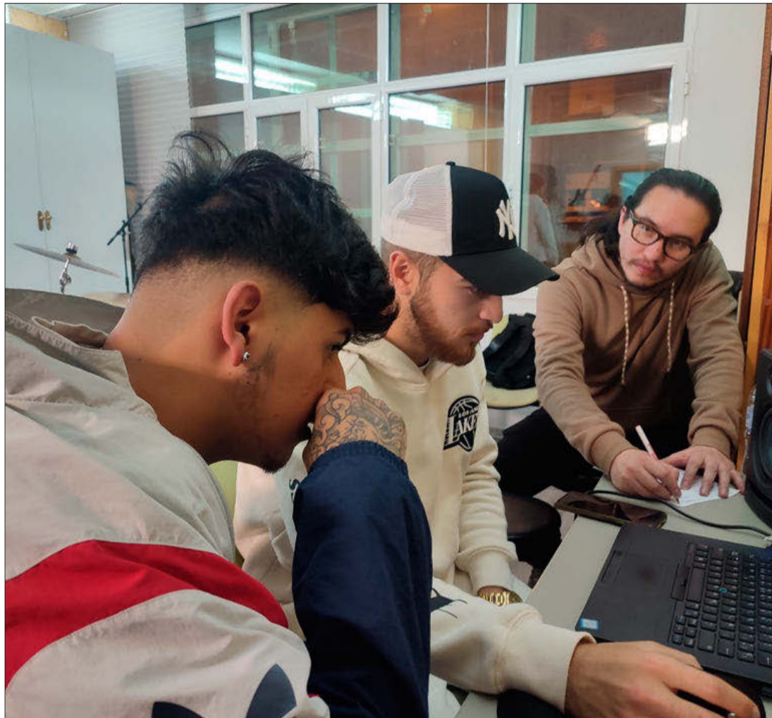
Proyecto Versos libres en la cárcel de Soria. HDS

En la convocatoria de 2023 se han presentado 283 propuestas de ar-