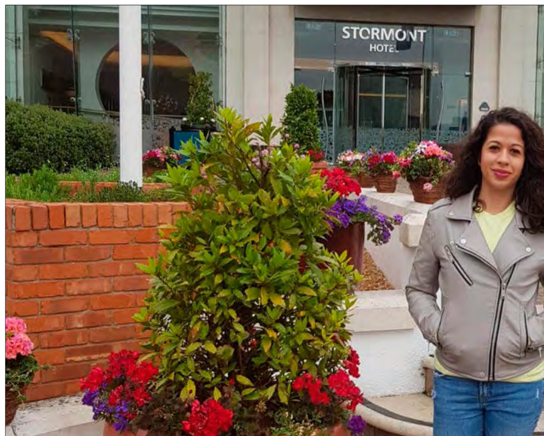
Participantes en el programa en sus lugares de destino.

trabajando en el hotel y que no descarta repetir experiencia Erasmus.