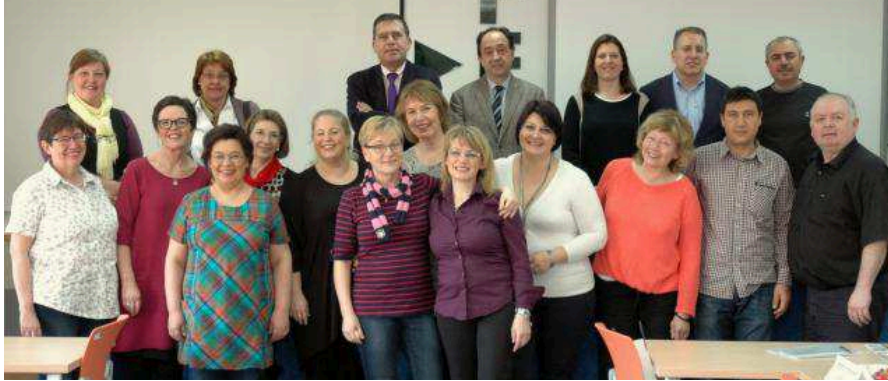
Representantes de las instituciones participantes en el proyecto, en la reunión mantenida en Soria en 2014. JCVL

Las siete instituciones que han participado en el proyecto europeo 'Grundtvig' se reunieron en la capital en marzo de 2014