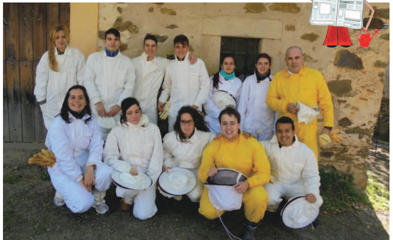
Alumnos y profesores en la experiencia de Granadilla.