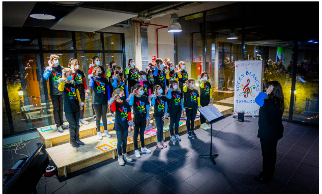
Concierto de las Voces Blancas, ayer en el mercado municipal.

Además, también visita el mercado Papa Noel, para que los más rezagados puedan darle sus cartas el día 24 a partir de las 11.00 horas. Durante todo el mes de diciembre